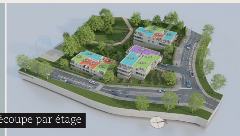
Découpe par étage