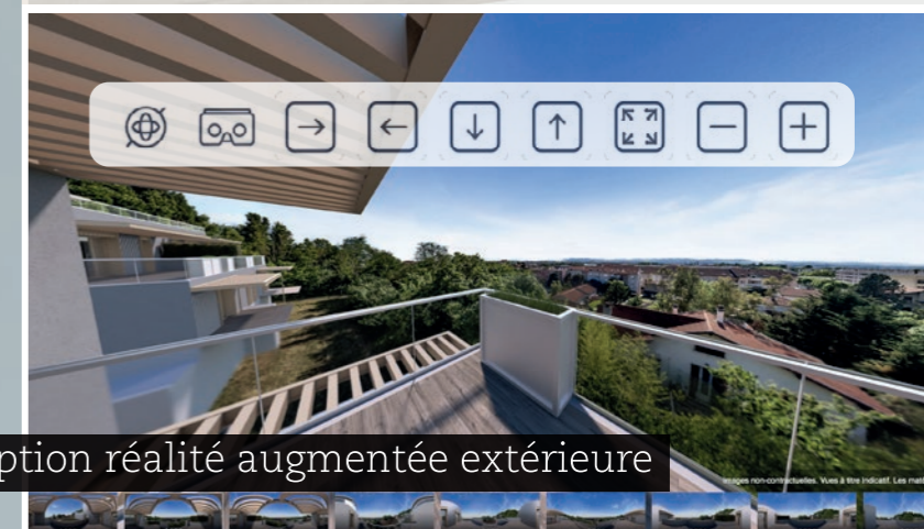
Option réalité augmentée extérieure